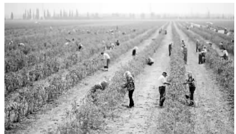
贺兰山下枸杞红 枸杞采摘工在枸杞基地采摘枸杞(7月11日摄)。近日,宁夏银川市贺兰山下的宁夏百瑞源贺兰山东麓有机枸杞示范基地迎来枸杞采摘季。该基地共种植枸杞及枸杞茶1500亩,是集枸杞新品种繁育、有机枸杞示范种植和生态观光于一体的现代化节水灌溉农业基地,在采摘季可解决当地1.2万农民临时就业。

1945年前后,第二次世界大战进入尾声,日本侵略军在仓皇撤退时,在中国遗弃了大量日本孤儿,总数超过4000人,其中九成以上集中在东北三省和内蒙古自治区。中日邦交正常化后,多数日本遗孤在中国政府和人民的帮助下回到了日本。