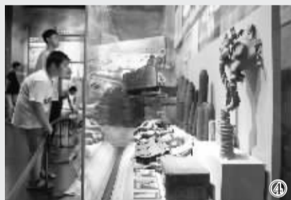
③ 7月12日,观众在中国人民抗日战争纪念馆观看展览。 ④ 7月12日,观众在中国人民抗日战争纪念馆观看侵华日军进行“细菌战”和“化学战”留下的种种罪证。

据新华社北京7月12日电(记者林苗苗)海拉尔劳工“万人坑”里的部分遗骨、南京大屠杀遇难者头骨、日军残害中国抗日军民的铁笼、日军使用的各类毒剂炮弹和防毒用具、大量被残忍杀害的无辜妇女和儿童……在中国人民抗日战争纪念馆举办的纪念全民族抗战爆发78周年暨《伟大胜利 历史贡献》主题展览中,日军暴行展示部分令人愤怒。