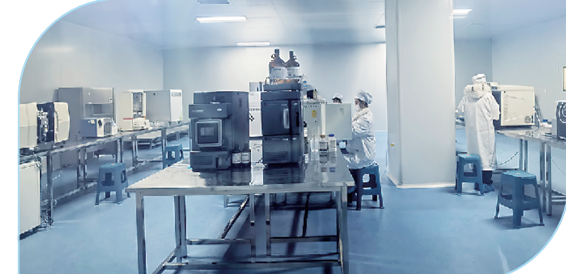
鑫丰生物经济产业园(一期)项目。