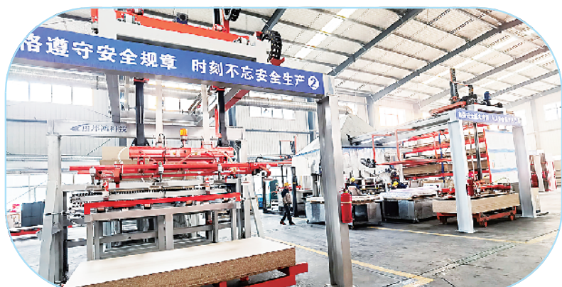
周口盛峰装饰材料有限公司年产1200万张OSB无醛板项目。