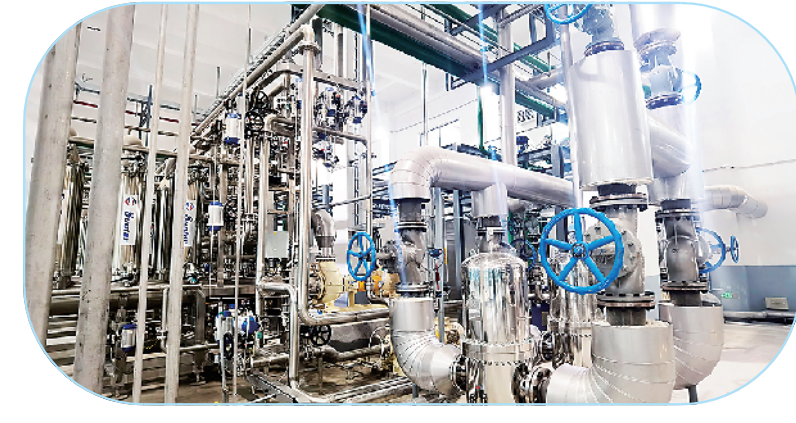
周口临港开发区年产15万吨果葡糖浆、10万吨麦芽糖项目。

鑫丰生物经济产业园(一期)项目: 该项目总投资6亿元,占地116亩,建设全自动聚丙烯输液生产线、全自动玻璃瓶无菌头抱生产线、全自动无菌粉冻干生产线以及全自动仓储车间、原料车间、制剂车间、仓库、研发楼、实验室等配套设施。目前,该项目一期已建成投产。项目投产达效后,预计实现年销售收入25亿元、年利税约1.5亿元,提供就业岗位200个。