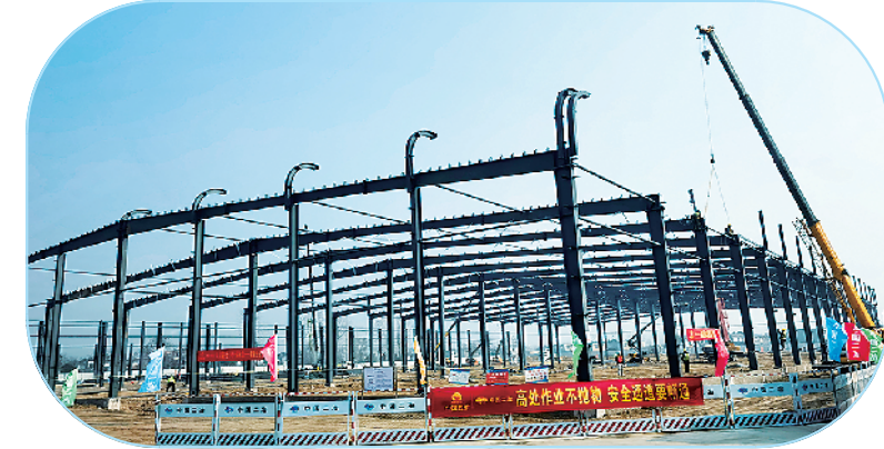
中农(周口)农资保供储备库项目。