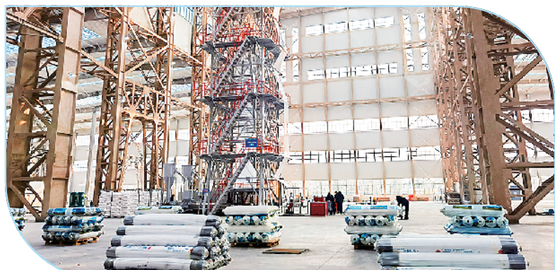
淮阳区天罡(银丰)可降解塑料生产线项目。

周口雅佳德音共轨喷油器智能生产基地建设项目: 该项目投资10亿元,占地面积319亩,总建筑面积20000平方米,主要建设高标准洁净度厂房40栋,新上高压共轨喷油器自动检测装配线40条,高压共轨喷油器测试设备400台,精密加工机床、清洗设备及相关附属设备100套。目前,7栋标准化厂房正在