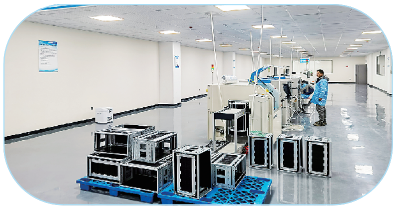
河南宇虹物联网科技有限公司小牛电气智能传感器生产项目。

周口盛峰装饰材料有限公司年产1200万张OSB无醛板项目: 该项目总投资1.5亿元,建筑面积约20000平方米。项目引进全自动装饰板贴面生产线2条,配备先进的全自动热压贴面机和自动上料机等关键设备,并特别引入智能ERP生产管理系统。目前,该项目正在试生产。项目投产达效后,预计年产值2.6亿元,实现利税2400万元,提供就业岗位30个。