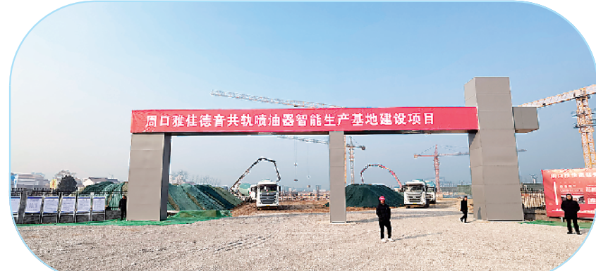
周口雅佳德音共轨喷油器智能生产基地建设项目。