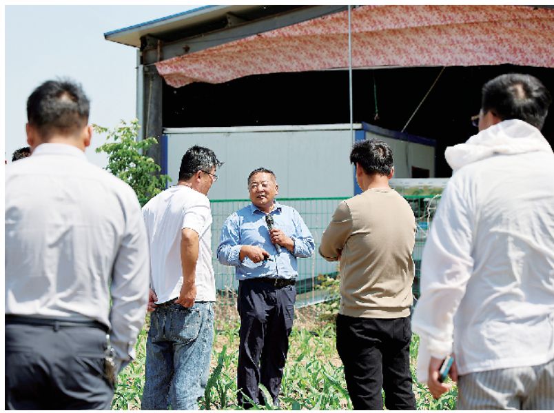
技术人员正在传授滴灌技术

5月16日上午10时,天气晴朗,沈丘县百余位种粮大户相聚周营镇绿生源种植专业合作社的一块实验田里,观摩“玉米单产提升滴灌带铺设暨水肥一体化”现场演示。头顶阳光毒辣,地上浮土飘荡,丝毫挡不住他们学习的热情。“咱们每亩玉米地现在能收1500