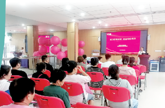
专业培训倡导母乳喂养。