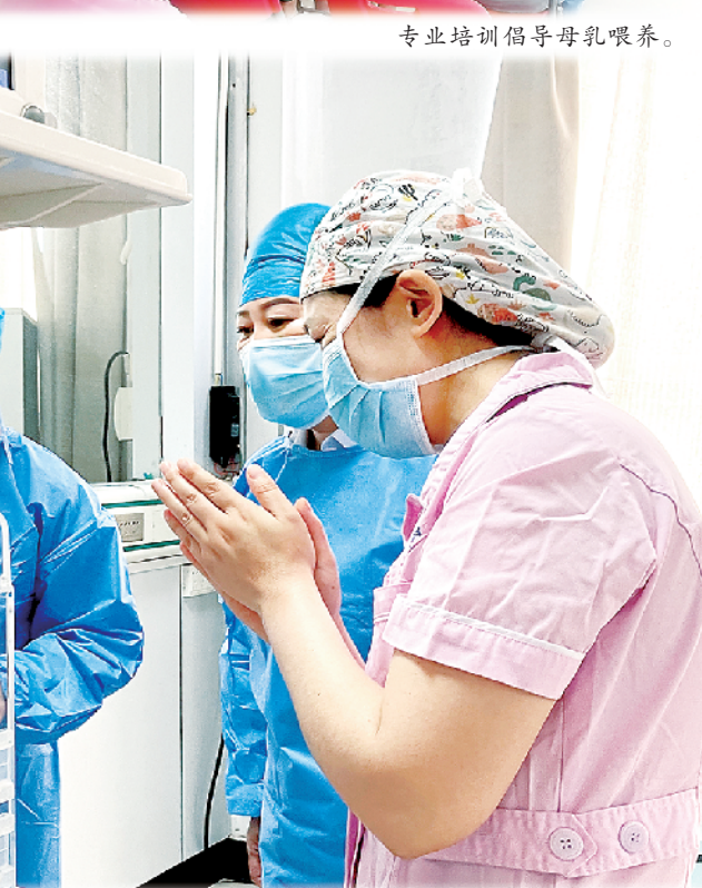
郸城妇幼新生儿呵护服务专业而优质。