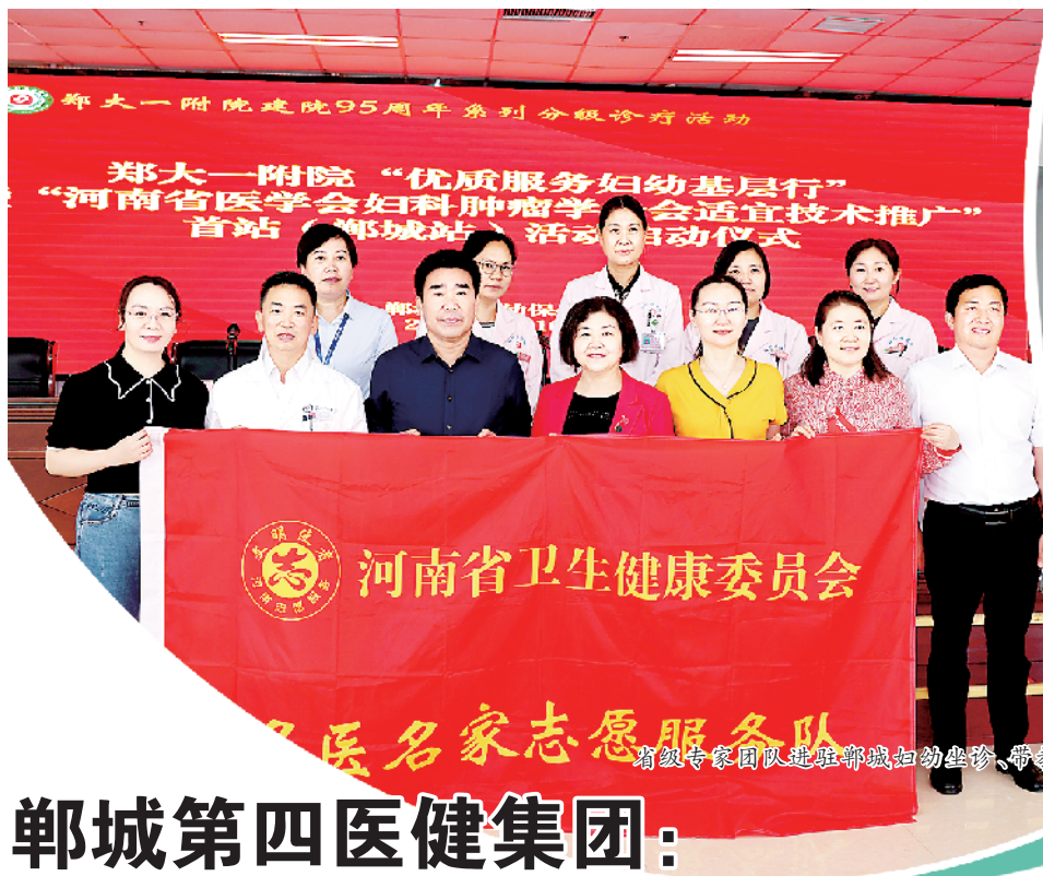
郸城第四医健集团: