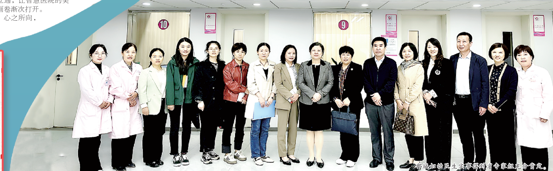
郸城妇幼民生实事解困省专家组充分肯定。