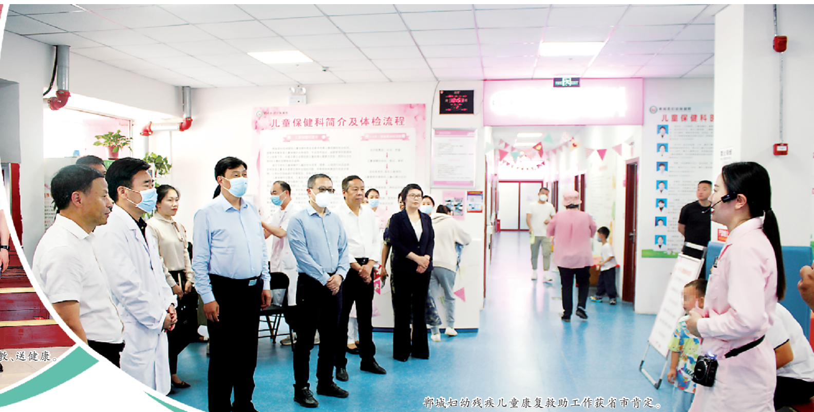
郸城妇幼残疾儿童康复救助工作获省市肯定。