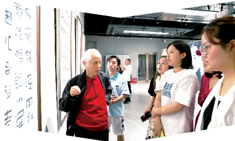
周口师范学院学生向书法名家现场请教。