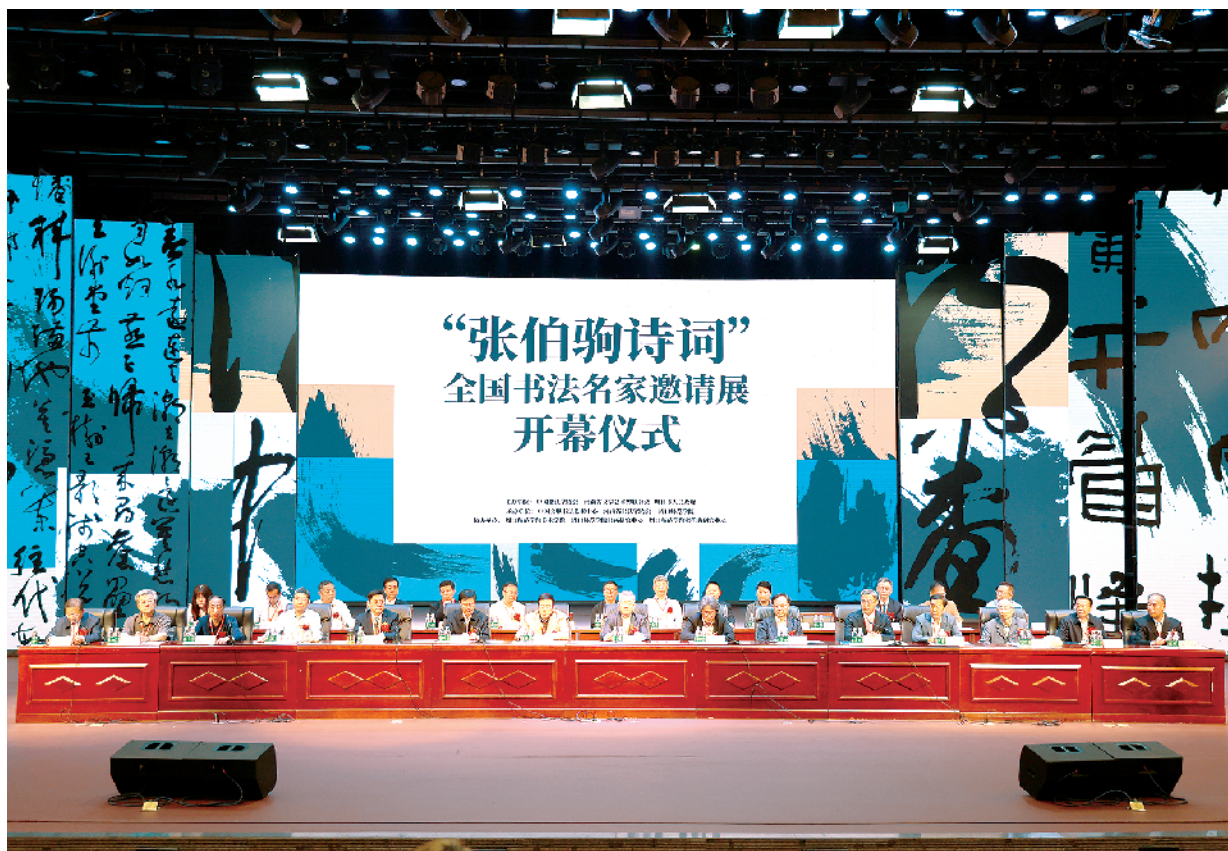
“张伯驹诗词”全国书法名家邀请展开幕式现场。

张伯驹是一位名满天下的大收藏家、书画家、戏剧家、诗词家，是当代文化高原上的一座峻峰，是爱国主义的楷模，是保护和传播先进文化的杰出代表、为人师表的典范。5月13日，由中国书法家协会、河南省文学艺术界联合会、周口市人民政府主办，中国文联书法艺术中心、河南省书法家协会、周口师范学院承办的“张伯驹诗词”全国书法名家邀请展在周口师范学院隆重开幕。