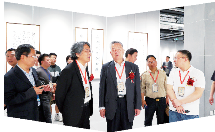
与会嘉宾参观展览。

观看展览的周口师范学院师生纷纷表示，本次活动是一场高品质的文化盛宴，对于学校进一步挖掘传统文化资源、深入开展文化教育、做好文化传承与创新、提升文化建设品位、助力学校高质量发展具有重要意义。