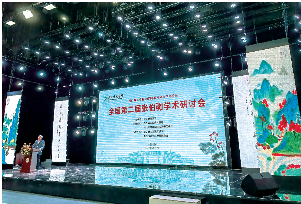
全国第二届张伯驹学术研讨会现场。

周口师范学院张伯驹研究中心主任任动表示，研究中心未来将以《张伯驹全集》编纂出版为基础，以国家社科基金重大项目为平台，举全校之力，凝聚多方力量，带领团队持之以恒、久久为功，努力实现学校党委提出的“打造全国平台、编纂一套全集、出版一套丛书、筹拍一部好剧、创办研究刊物、办好每年年会”的工作目标，为建设百年名校增光添彩，为建设文化强国凝聚智力。（高志明）